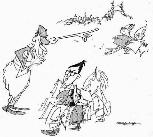
Vatandaş — Yine kötü gittiye ne yapalım yani... Siz de bunlar gibi çalışıp, ikmüle kalmasaydınız!

— Tek dersten kalanlar imtihana girdiler. —